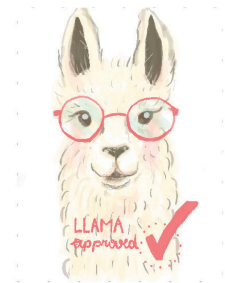
Beispiele für Sticker